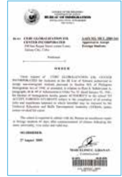
菲律賓移民局SSP認證