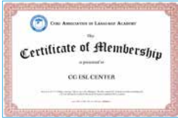
宿霧語言學校協會